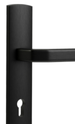
със стандартна ръкохватка