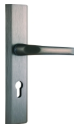
със стандартна ръкохватка