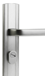
със стандартна ръкохватка