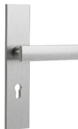
със стандартна ръкохватка