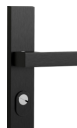
със стандартна ръкохватка